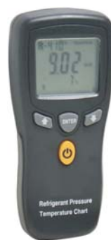
DPTC-61 CALCOLATRICE DIGITALE AC&R (accessorio)