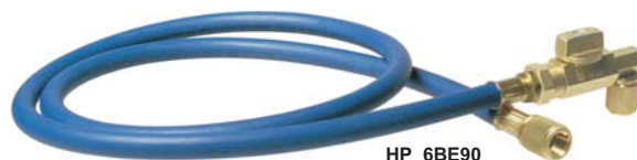
HP 6 BE90