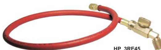
HP 3 RE45