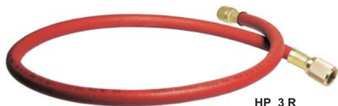
HP 3 R