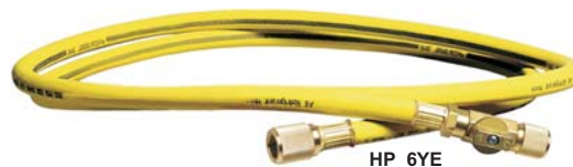
HP 6 YE