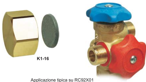
Applicazione tipica su RC92X01

Per installazione sulle Valvole delle bombole di refrigerante con capacità >10 Kg.